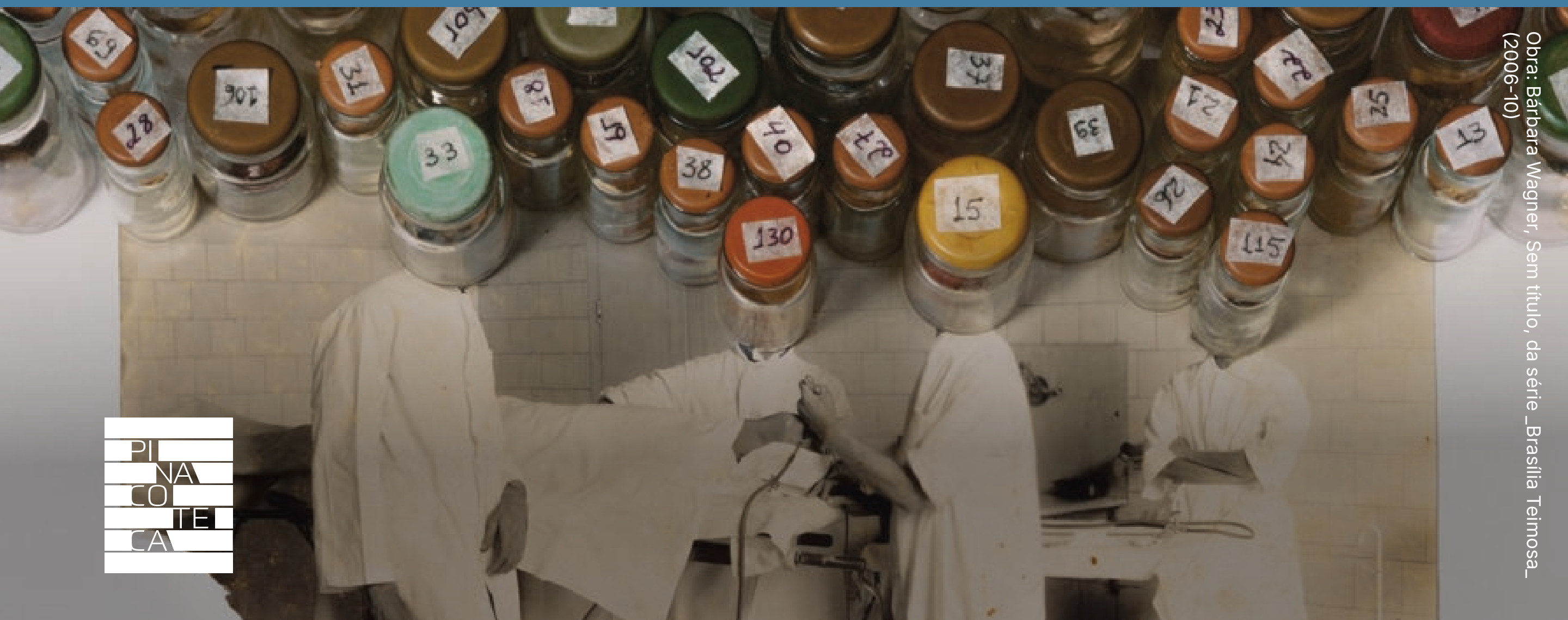
Obra: Bárbara Wagner, Sem título, da série _Brasília Teimosa_ (2006-10)